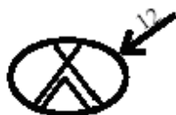
Về Trại Lúc 12 Giờ - Return To Camp At 12